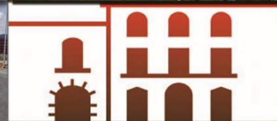
Palau Castell de Betxí