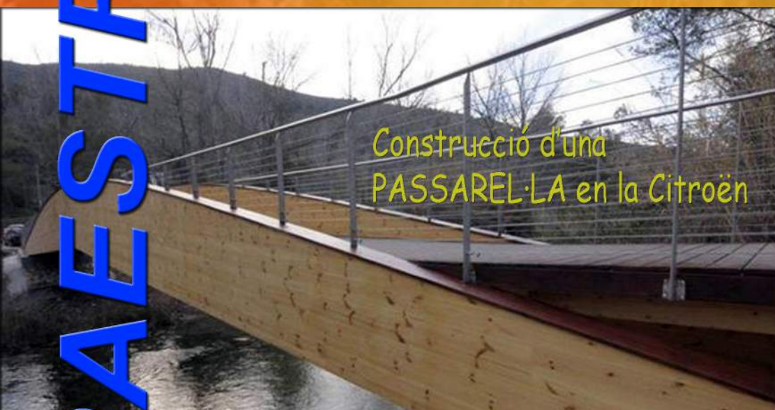
Construcció d'una PASSARELLA en la Citroën