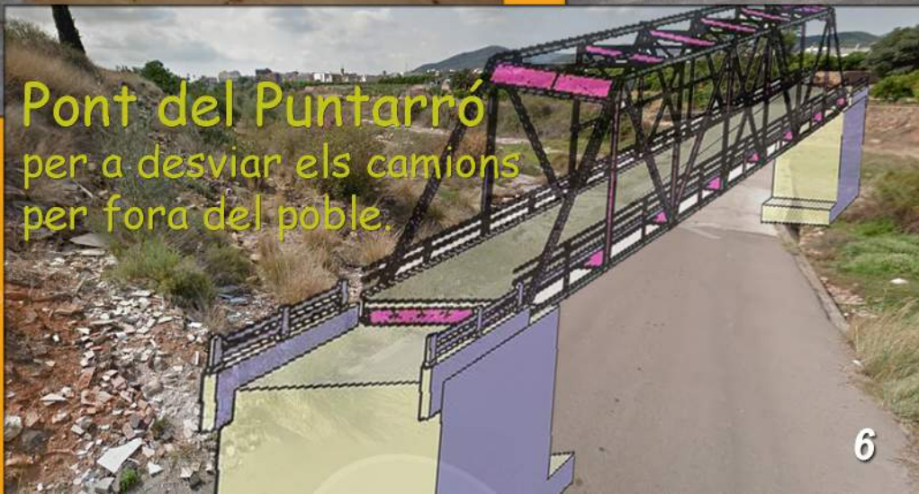
Pont del Puntarró per a desviar els camions per fora del poble.